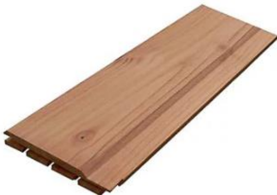
Clin pour bardage douglas naturel L.2500 x l 120