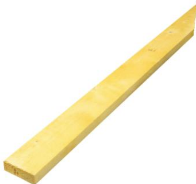
Liteaux brut traité ép 22 mm x l 70 mm x L 2 400 mm